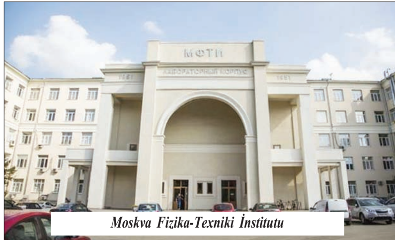
Moskva Fizika-Texniki İnstitutu