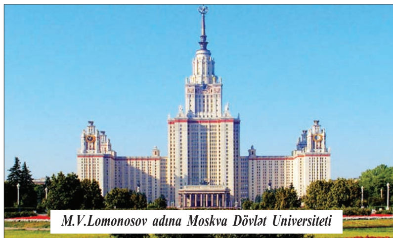
M.V.Lomonosov adına Moskva Dövlət Universiteti