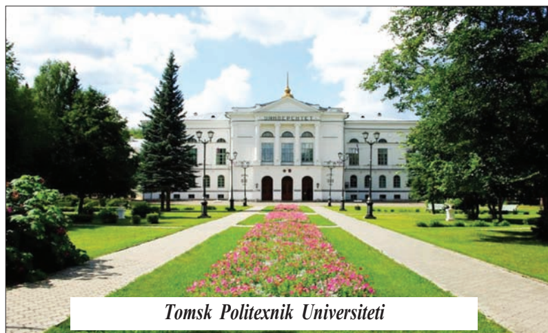
Tomsk Polixnik Universiteti